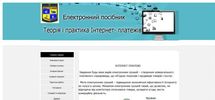
Рис. 1. Головна сторінка електронного посібника

Сторінка, яка містить головне меню, має чотири блоки, а саме: верхній блок містить заголовок з інформацією про посібник, лівий блок – головне меню, яке є основним елементом навігації, правий блок – зміст документу, який відображається при натисканні на посилання з лівого блоку, нижній блок – головна карта посібника (рисунк 1).