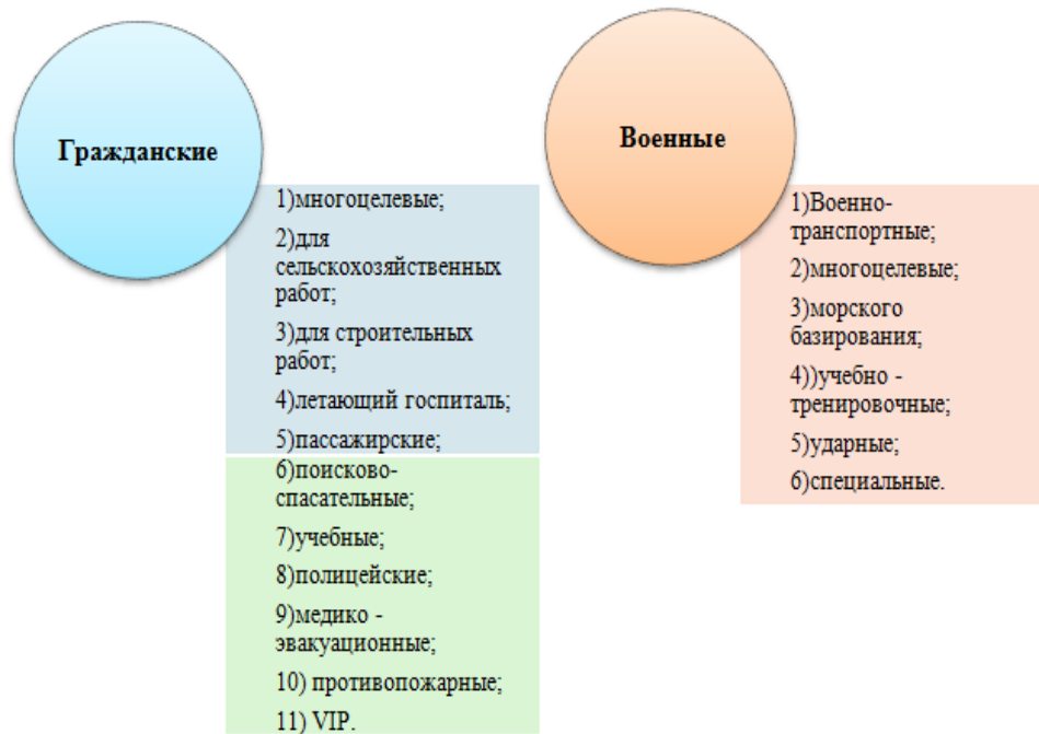
Рис. 2. Ассортимент холдинга «Вертолеты России» [2]

Рассматривая потребности всех сегментов целевых рынков был сформирован модельный ряд продукции АО «Вертолеты России». (табл. 2). Наиболее перспективной моделью для Латинской Америки будет являться «Ми 8/17», а именно средний многоцелевой вертолет. Модель «Ка-32А11ВС» для данного сегмента будет приоритетной категорией в связи с широким спектром применения, что очень актуально для Латинской Америки.