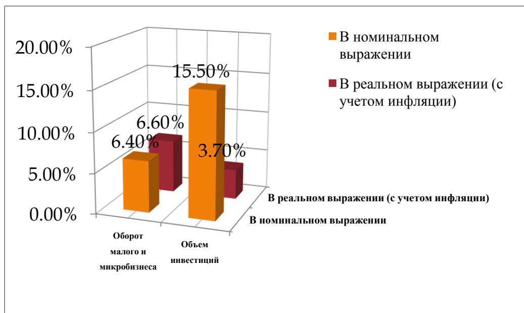
Рисунок 1 – Показатели деятельности предприятий в 2014 году

Однако, ни замедление темпов роста экономики, в частности потребительского спроса в 2014 году из-за ввода экономических санкций, ни удорожание банковских кредитов (увеличение ключевой ставки до 17 %) не остановило рост числа предпринимателей, относящихся к сегменту малого и микробизнеса.