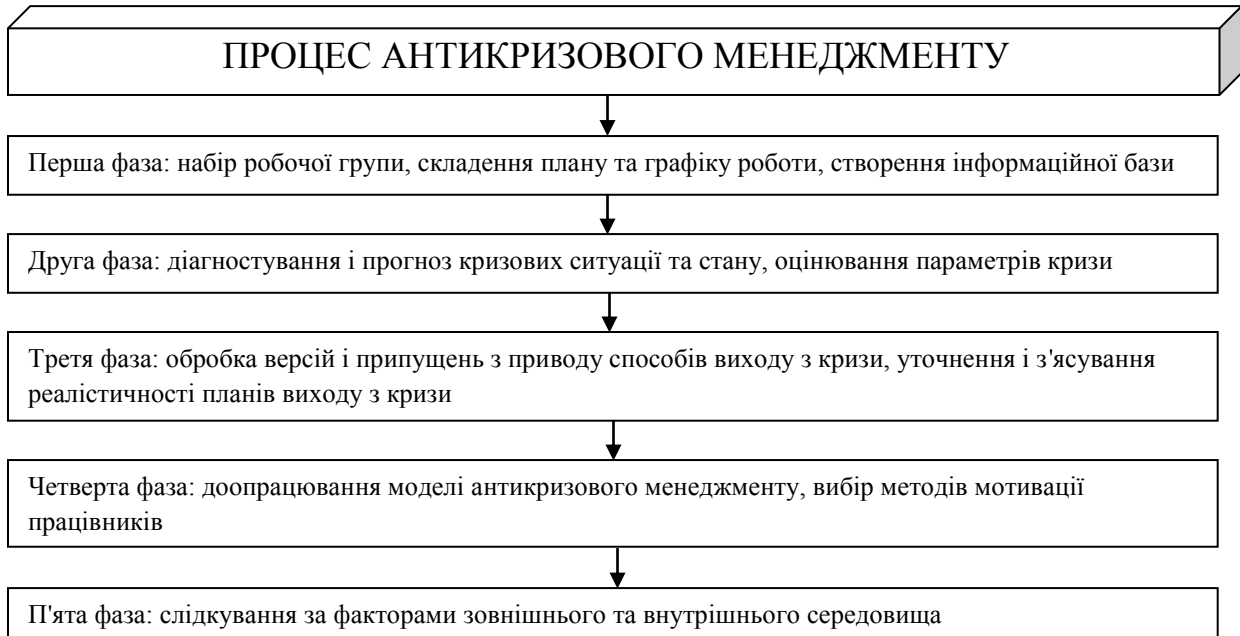
Рис. 2. Фази процесу антикризового менеджменту [3]

роботи. Окрім цього, при здійсненні антикризового менеджменту необхідно брати до уваги фазу, на якій знаходиться розвиток теорії та практики управління, механізм запобігання та виходу з кризових ситуацій [3]. З огляду на це, процес антикризового менеджменту, можна схематично зобразити на рис.2.