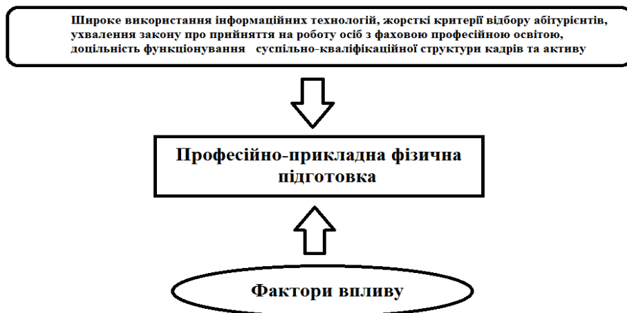
Рис. 1. Структурно-логічна схема вдосконалення професійно-прикладної фізичної підготовки: розроблено авторами на основі [4]

Аналіз професійної підготовки фахівців фізичної культури у провідних країнах світу дає змогу дійти висновку, що найбільш вагомими ідеями для вдосконалення даної підготовки є: широке використання інформаційних технологій; жорсткі критерії відбору абітурієнтів; ухвалення закону, що закріплює прийняття на роботу осіб з фаховою професійною освітою; доцільність функціонування суспільно-кваліфікаційної структури кадрів та активу (рис. 1).