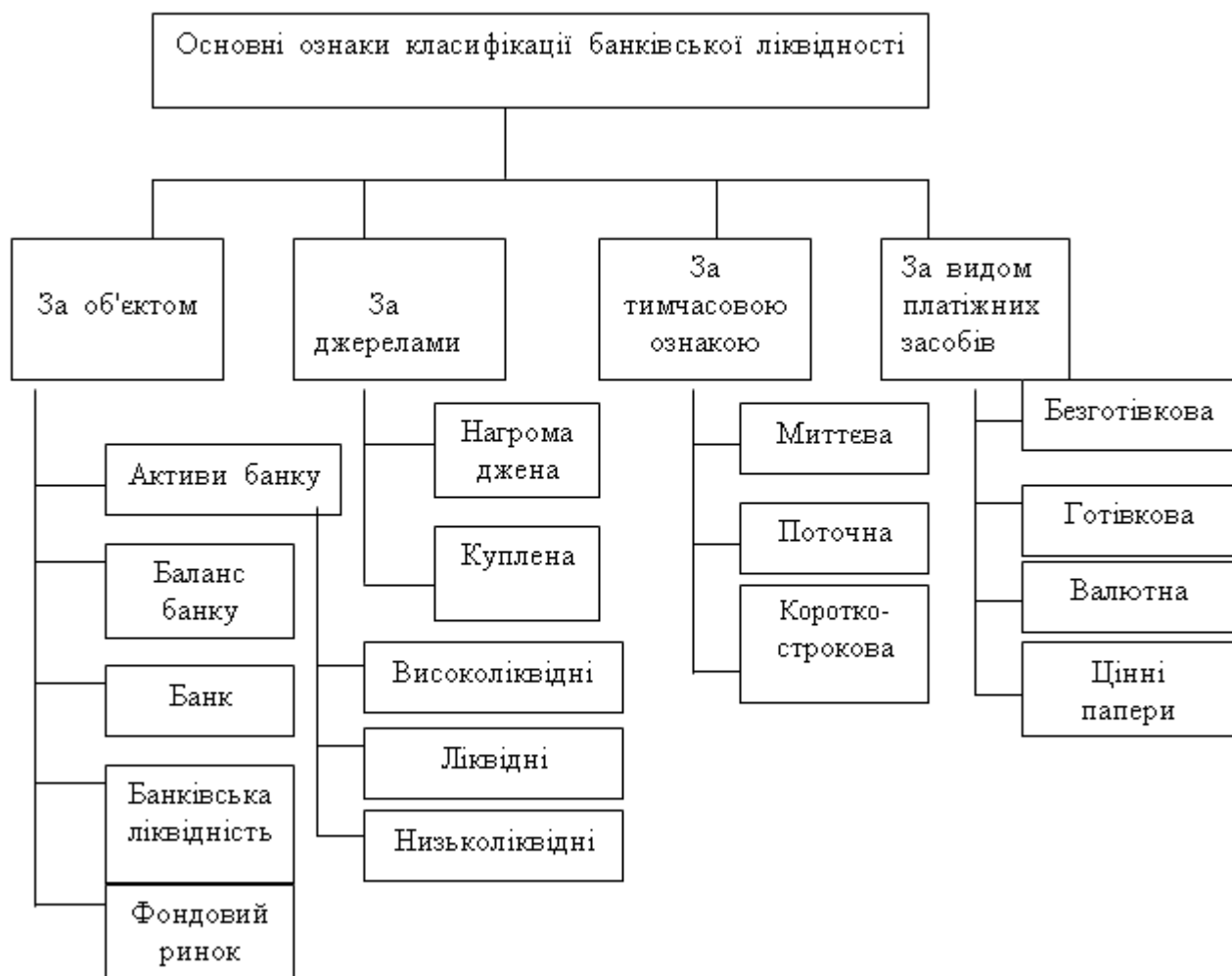
Рисунок 3. Класифікація банківської ліквідності за різними ознаками

Пояснюється це тим, що з ліквідністю пов'язане широке коло питань щодо ефективності діяльності банківської установи.