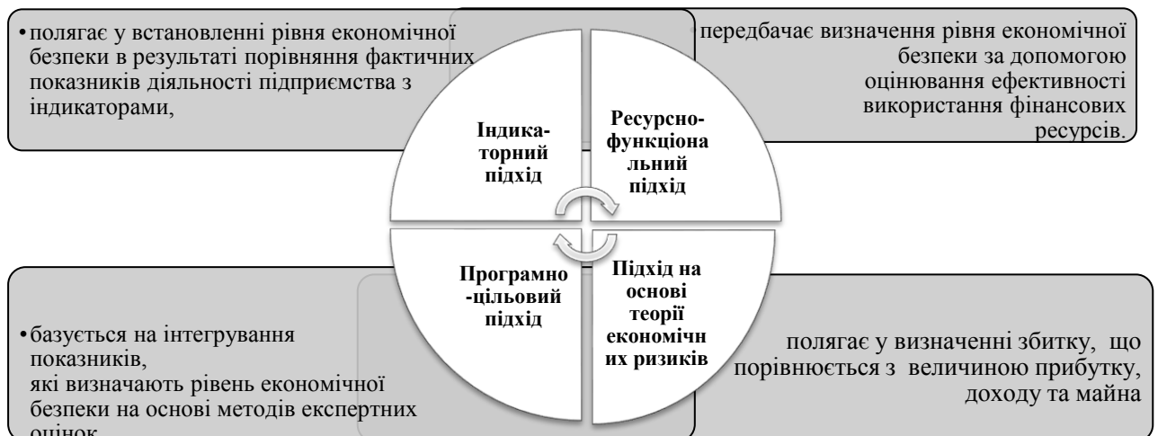
Рис. 1. Методи кількісного оцінювання рівня фінансово – економічної безпеки

Для визначення кількісного рівня фінансово - економічної безпеки підприємства використовується декілька підходів: індикаторний (пороговий), ресурсно- функціональний, програмно-цільовий (комплексний), підхід на основі теорії економічних ризиків (рис. 1).