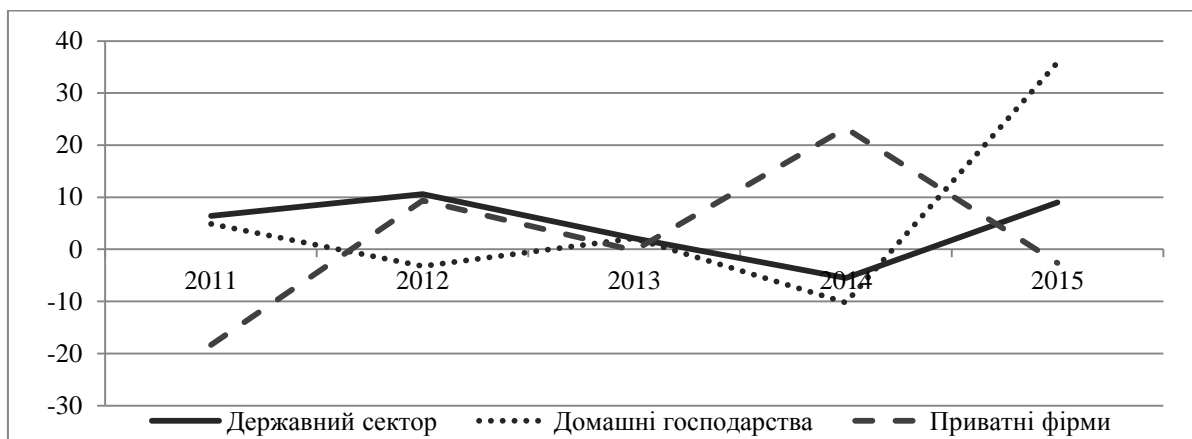
Рис. 3. Динаміка витрат на вищу освіту в розрізі джерел фінансування (2011-2015 рр., у % до минулого періоду) [розраховано і побудовано автором на основі [5]]

навчальних закладів у поточному році. Також вказується, що обсяг видатків на поточний рік формується виходячи з показника видатків минулого року, скоригованого на коефіцієнт інфляції, і не може бути меншим за цю величину. Поступове зростання рівня витрат на вищу освіту та превалювання державного фінансування свідчить про пріоритетність розвитку сфери вищої освіти для країни та реалізації політики забезпечення широкого доступу до освітніх послуг, що відповідає цілям сталого розвитку ООН.