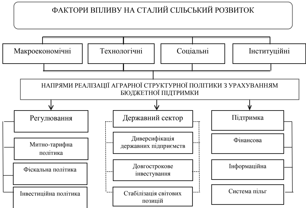
Рис. 2. Схема реалізації аграрної структурної політики в контексті сталого сільського розвитку

довгостроковий характер та орієнтуватися на підвищення конкурентоспроможності сільськогосподарської продукції на світових ринках продовольства, що передбачає перехід до стратегічного управління розвитком із залученням додаткових ресурсів.