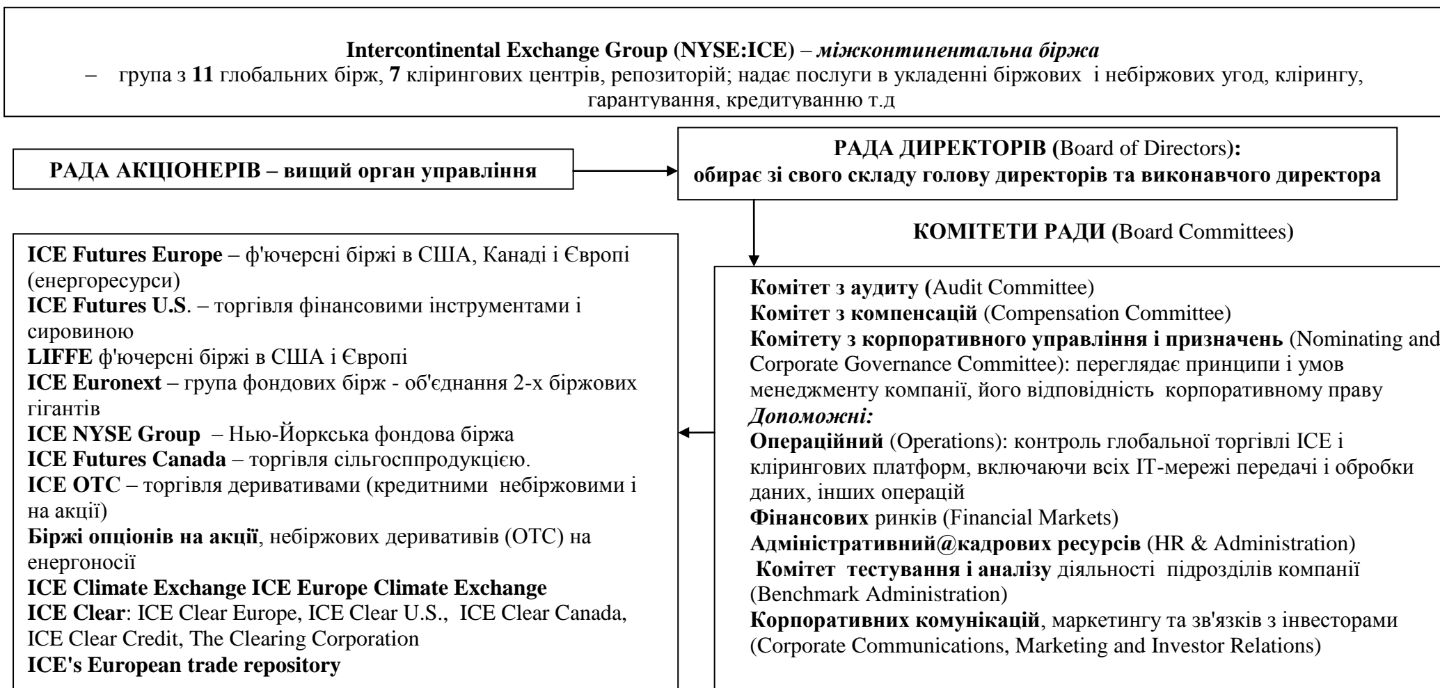
Рис. 3. Сучасна (модерна) організаційна структура біржі

(На прикладі Міжконтинентальної біржі Intercontinental Exchange Group (NYSE:ICE) (Складено автором за [8])