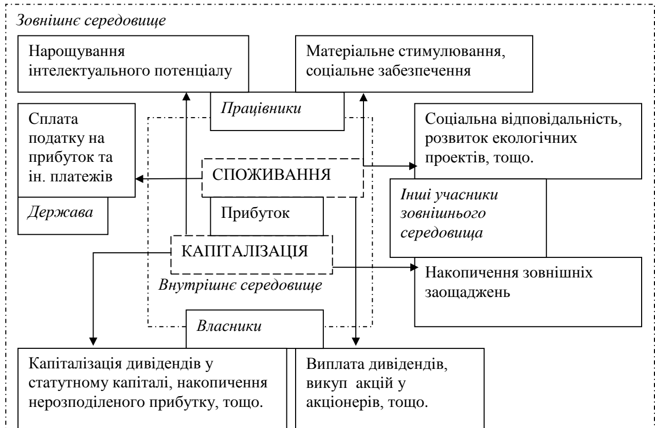
Рис. 3. Напрями удосконалення розподілу прибутку в умовах господарювання транспортних підприємств України*

заохочення за плідну працю, на соціальну підтримку тощо; прибуток, що залишається на підприємстві та є фінансовим джерелом його розвитку.