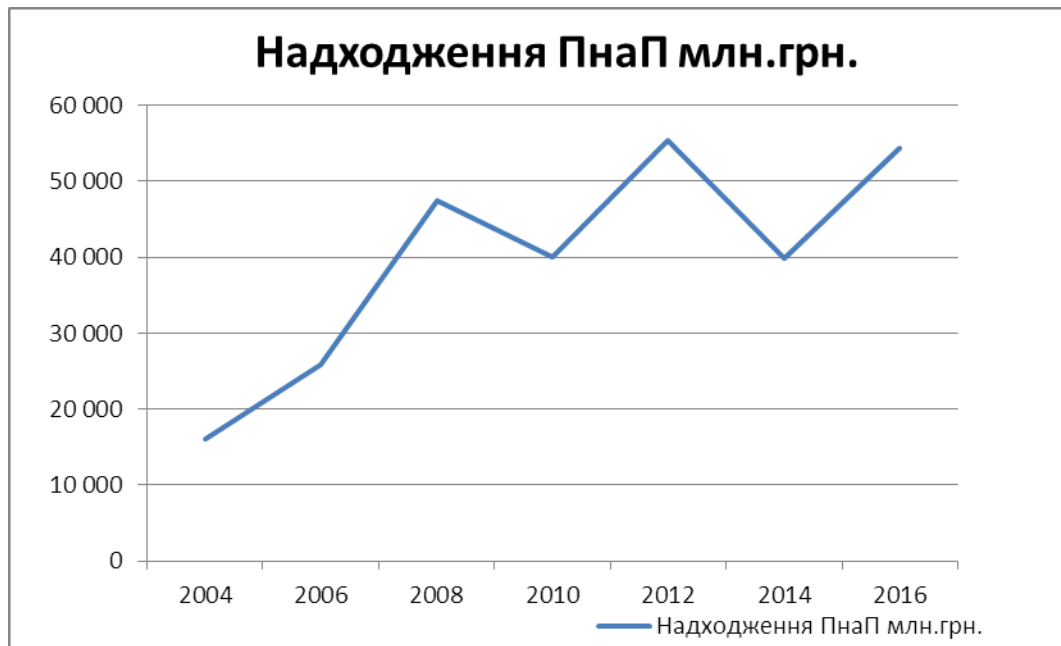
Рис. 1. Динаміка надходжень податку на прибуток, тис. грн.

Варто також проаналізувати динаміку податку на прибуток протягом аналізованого періоду (рис. 1).