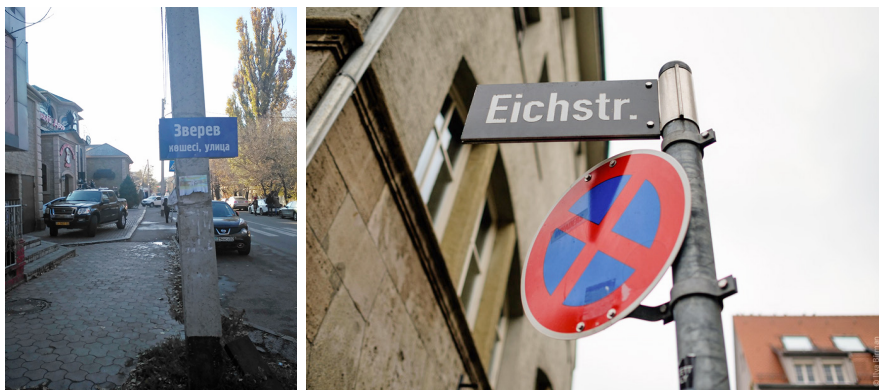
Рисунок 4. Указатели на столбах (слева в Алматы, справа в Лондоне)

Удобочитаемость текста. В Алматинских табличках слова прилеплены друг к другу, ширина букв и расстояние между ними варьируется от слишком маленького до слишком большого в одном и том же указателе. Контрастность букв с засечками проигрывает по сравнению с рубленными. В английском варианте используется шрифт без засечек, который обладает высокой удобочитаемостью при послоговом чтении. Так же используется шрифт большого кегля с большей шириной, большим межбуквенным расстоянием и интерлиньяжем. Высокая контрастность текста и фона лондонских указателей увеличивает удобочитаемость, потому что для отражающих свет поверхностей самым лучшим является сочетание черного текста и белого фона (Рисунок 5).