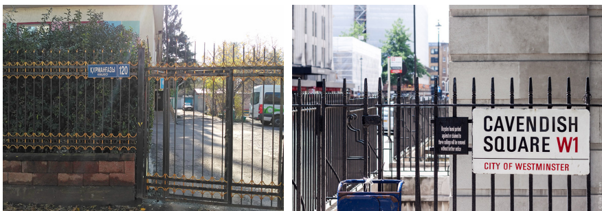
Рисунок 3. Указатели на заборах (слева в Алматы, справа в Лондоне)

В Лондоне местоположение регулируется государством, которое запрещает уродовать или скрывать архитектурные сооружения. Поэтому многие указатели размещены на заборах или столбах (Рисунок 3, 4).