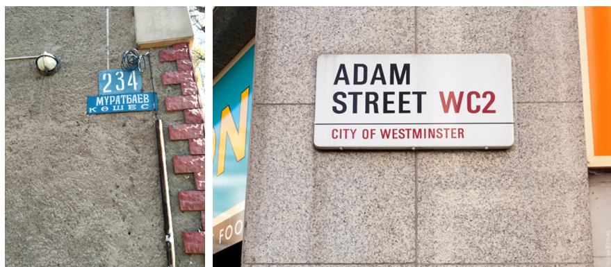
Рисунок 5. Удобочитаемость (слева в Алматы, справа в Лондоне)

Удобочитаемость текста. В Алматинских табличках слова прилеплены друг к другу, ширина букв и расстояние между ними варьируется от слишком маленького до слишком большого в одном и том же указателе. Контрастность букв с засечками проигрывает по сравнению с рубленными. В английском варианте используется шрифт без засечек, который обладает высокой удобочитаемостью при послоговом чтении. Так же используется шрифт большого кегля с большей шириной, большим межбуквенным расстоянием и интерлиньяжем. Высокая контрастность текста и фона лондонских указателей увеличивает удобочитаемость, потому что для отражающих свет поверхностей самым лучшим является сочетание черного текста и белого фона (Рисунок 5).