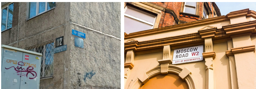
Рисунок 2. Местоположение указателя на зданиях (слева в Алматы, справа в Лондоне)

Местоположение указателей наименования зданий и сооружений в Алматы не имеют какой-либо функциональной логики. Они могут быть расположены на зданиях, столбах рядом с домом, гаражах или заборах (рисунок 2).