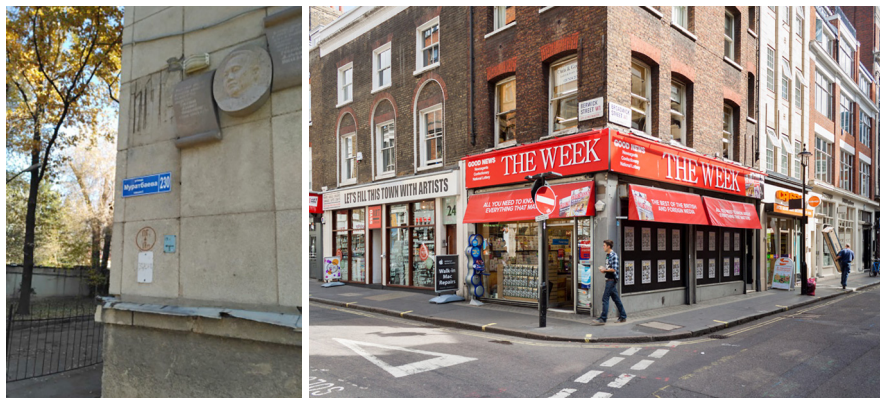
Рисунок 1. Размер табличек (слева в Алматы, справа в Лондоне)

Размер табличек в Алматы имеет неудобочитаемый масштаб. Учитывая большие пространства между домами, в отличие от Лондона, прочесть название улицы и номер дома сложно.