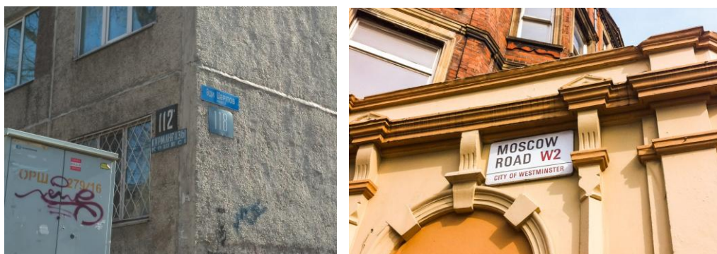
Рисунок 2. Местоположение указателя на зданиях (слева в Алматы, справа в Лондоне)

Местоположение указателей наименования зданий и сооружений в Алматы не имеют какой-либо функциональной логики. Они могут быть расположены на зданиях, столбах рядом с домом, гаражах или заборах (рисунок 2).