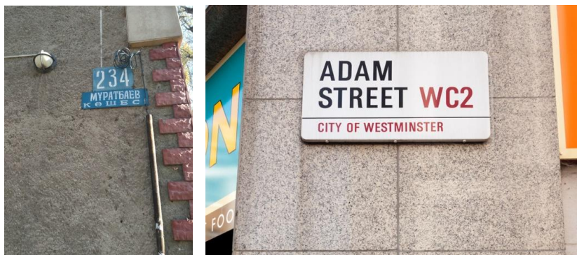
Рисунок 5. Удобочитаемость (слева в Алматы, справа в Лондоне)

Графические элементы должны создавать определенный образ указателей, соответствующие образу пространства, которому они принадлежат [5, с.23-67; 6, с.56-89]. В Лондоне графические элементы, такие как орнаменты, рамки и логотипы, расположены строго в определенном районе или на определенном здании, сооружении. В Алматы графические элементы в большинстве случаев используются на частных домах (Рисунок 6).