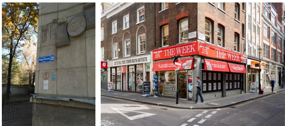
Рисунок 1. Размер табличек (слева в Алматы, справа в Лондоне)

В Лондоне размер и пропорции рассчитаны на то, что их будут читать люди находящиеся на противоположной стороне улицы, то есть они достаточно большие (Рисунок 1).