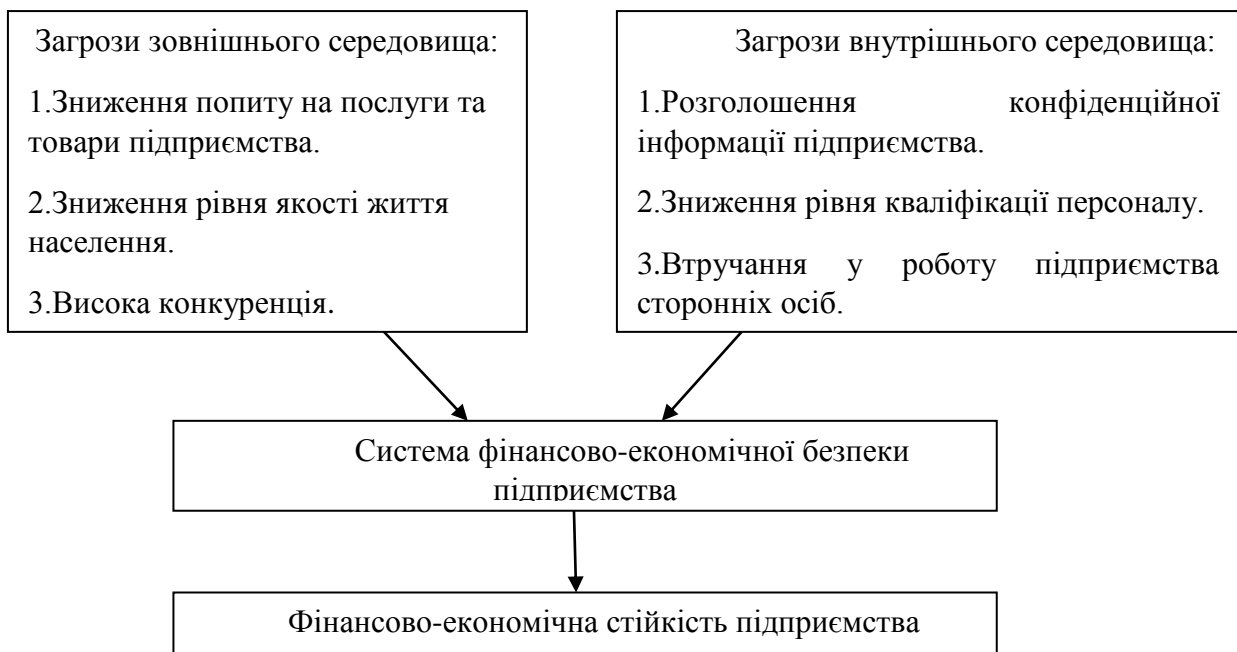
Рис. 1. Цілі і завдання фінансово-економічної безпеки підприємства [4, с.314]

Головною метою системи фінансово-економічної безпеки підприємства є забезпечення його стійкого і максимально ефективного функціонування в даний час і забезпечення високого потенціалу розвитку і зростання підприємства в майбутньому. Загалом, цілі і завдання фінансово-економічної безпеки можна представити у вигляді схеми (рис. 1) [4, с.314].