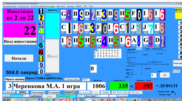
Рис. 6. Игровое поле модели

На рис. 6 приведено игровое поле с результатами сеанса Черенковой М.А., который закончился дефолтом. График динамики капитала, приведенный на рис. 7 говорит о слабых результатах управления: на графике слишком много линий на убывание капитала.