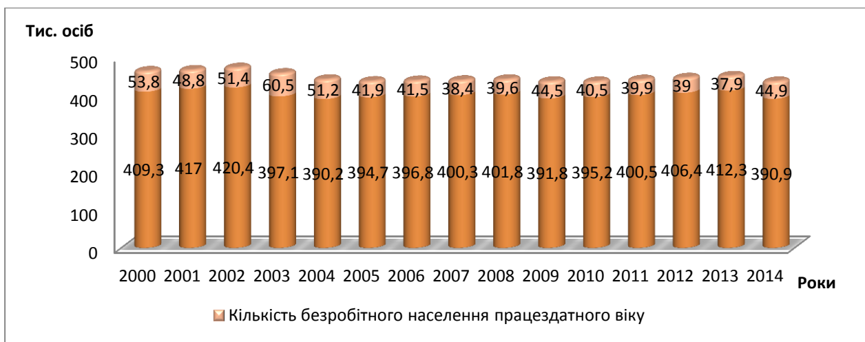
Рис. 1. Динаміка кількості економічно активного населення працездатного віку в межах Волинської області за період з 2000 р. по 2014 р. (За даними Головного управління статистики у Волинській області).

За основу дослідження був взятий поточний період – 14 років (з 2000 р. по 2014 р. включно). У динаміці кількості економічно активного населення за досліджуваний період чітко прослідковується тенденція до зменшення. Зокрема, у 2000 році кількість населення у віковій категорії 15-70 років становила 540 тис. осіб, а станом на 2014 рік – 455,4 тис. осіб, що є наслідком негативних проявів у демографічних процесах досліджуваного регіону. Основу економічно активного населення становлять особи працездатного віку (жінки – від 16 до 59 років, чоловіки – від 16 до 64 років включно), кількість яких в межах Волинської області повільно зменшувалась з 2000 р. по 2003 р. включно, після чого різко скоротилась з 409,3 до 390,2 тис. осіб. у 2003 році. За період з 2004-2013 рр. прослідковувалась тенденція до зростання, хоча й незначна (з 390,2 до 412,3 тис. осіб). Дана тенденція не була характерною для 2014 року внаслідок впливу на дану сферу економіки економічної та політичної кризи в державі [3].